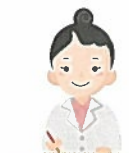
医療・介護関係者

北九州市または とびうめネット事務局から 確認の連絡をさせていただく ことがあります。