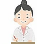
医療・介護関係者