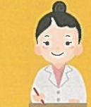
医療・介護関係者