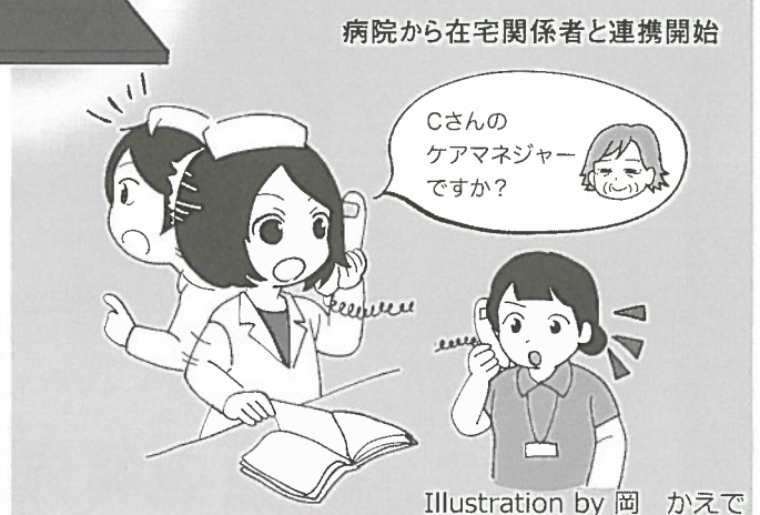
Illustration by 岡 かえで

※登録を勧める市長メッセージや事業内容の動画を北九州市ホームページに掲載しています。 「とびうめ@きたきゅう」で検索してください。